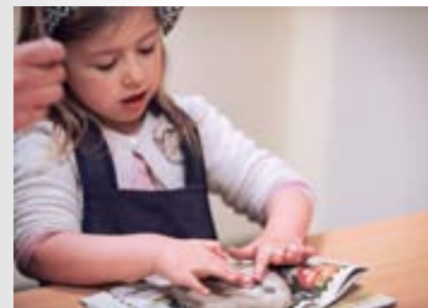
01. Matières, formes, volumes. Bas-relief en terre