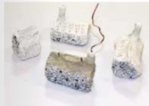
01. Imagine ta propre usine