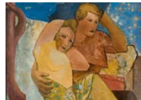
02. Edgard Scaufaire (détail)