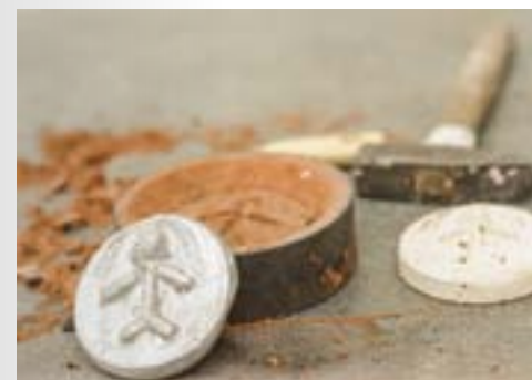
02. Alchimie & magie du métal