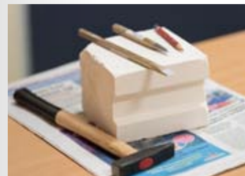
01. Taille sur bloc