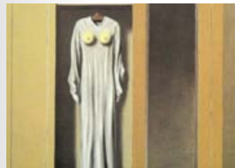
01. René Magritte (détail)