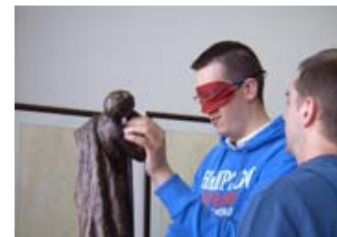
02. Visite de sensibilisation