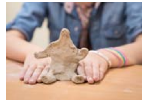
01. Matière & volumes