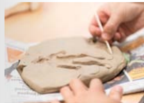
01. Matière & volumes