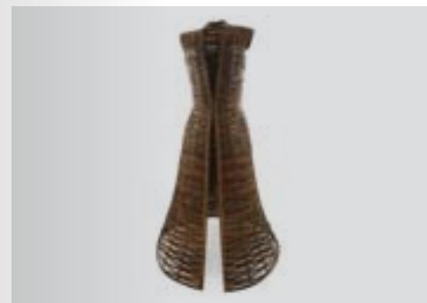
03. Jean-Claude Saudoyer