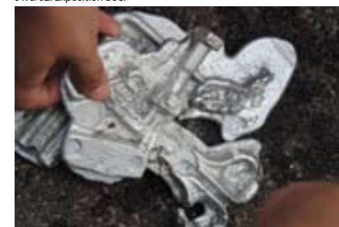
01. & 02. Exposition Boël