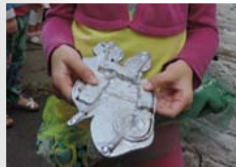
02. Atelier coulée du métal