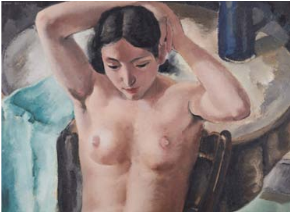
Léon Devos. Nu assis, 1932 (détail)