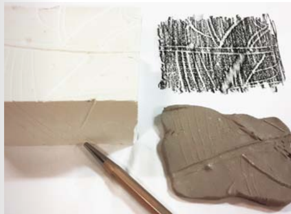
04. Graver le volume — Plâtre/Terre/Papier