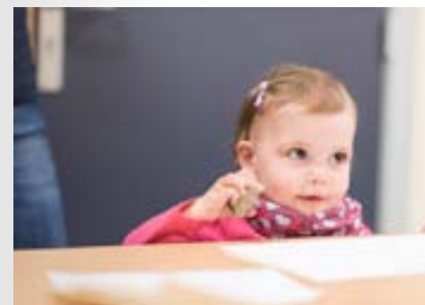
01. Matières, formes, volumes. Modelage en terre