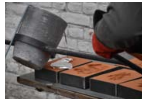
02. Atelier coulée du métal