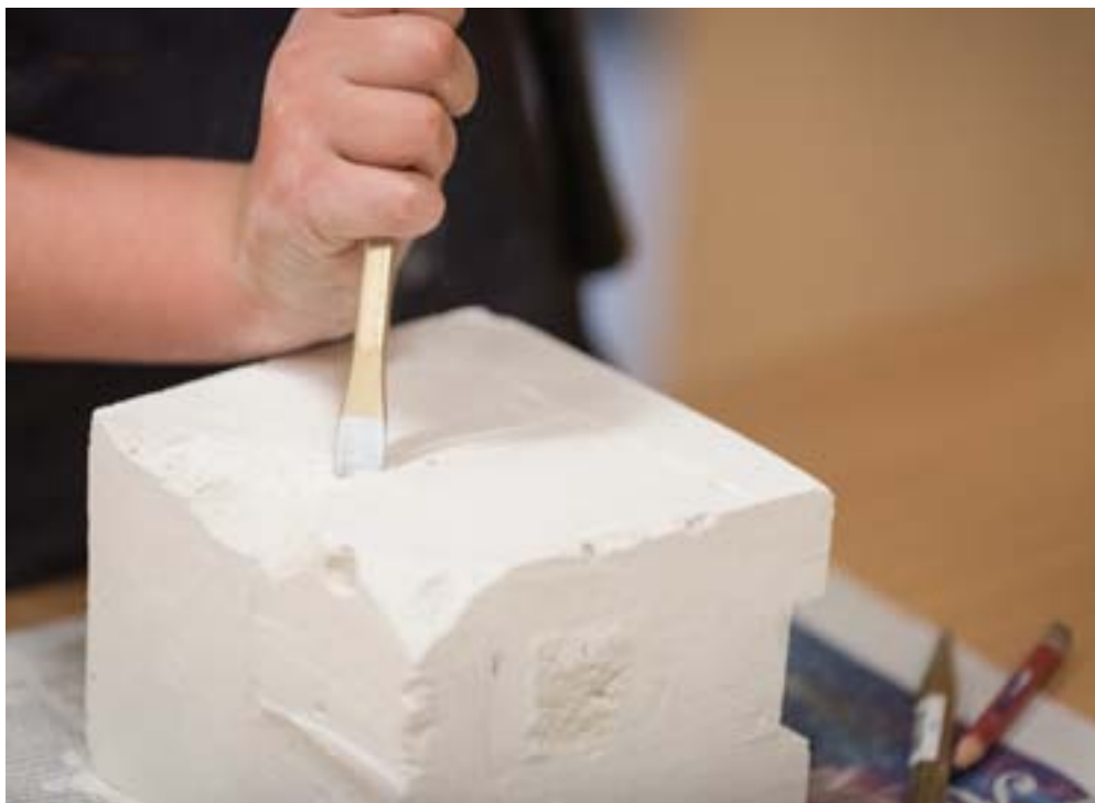
04. Les secrets de la pierre