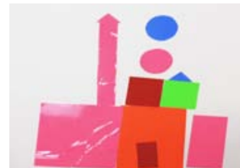
01. Imagine ta propre usine

À partir de 7 ans Durée (visite + atelier créatif) : 2h30 Coût : 3 € par élève