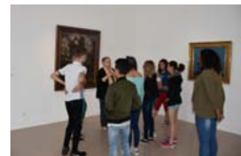
01. & 02. Exposition Boël