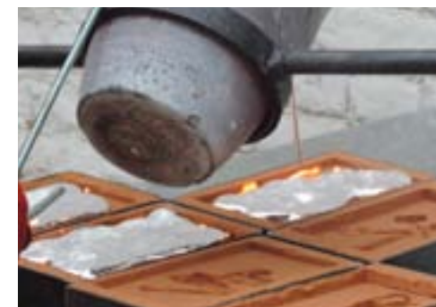
01. Coulée du métal