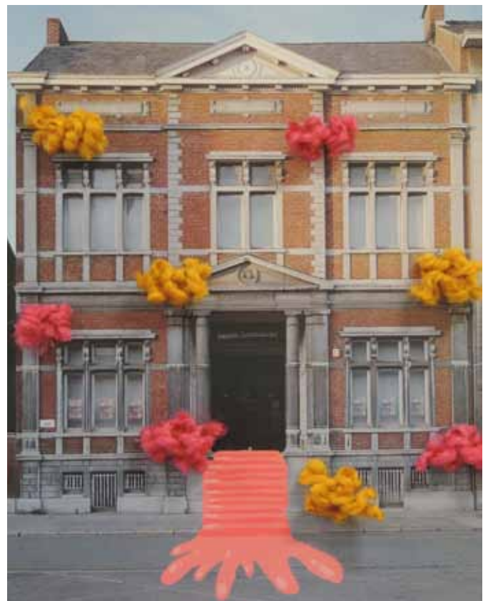
Eloïse Duot - Sara Signore